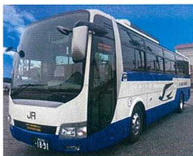
《運行車両・座席イメージ》